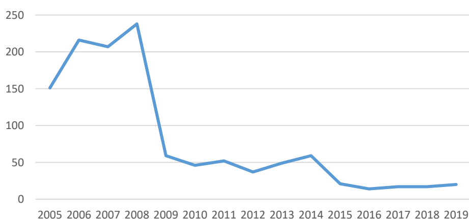
Figura 2. Scavi clandestini rilevati dai Carabinieri, Comando TPC.